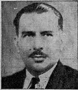
LIC. DON TEODORO PICADO

Ya el público costarricense tiene conocimiento de que, en fecha